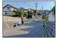
① 畑谷町 (若潮駅前)