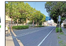
⑧ 佐藤公園下 (行き)