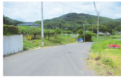
③ 外小竹公民館入口