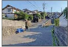
① 畑谷町 (若潮寮前)