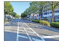
⑧A 佐藤公園下 (帰り)