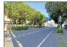
⑧ 佐藤公園下 (行き)